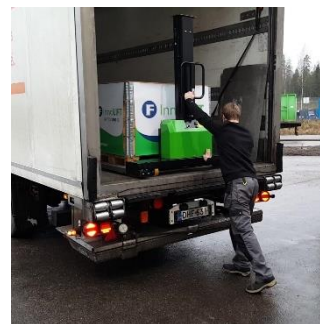
Ustaw towar i wózek w samochodzie

Samozaładowczy wózek podnośnikowy InnoLIFT jest przeznaczony do prac transportowych oraz załadunku i rozładunku towarów na samochodach dostawczych typu VAN, plandeka, kontener, samochodach ciężarowych i innych miejscach, gdzie użytkownik znajdzie zastosowanie dla tego typu urządzenia.