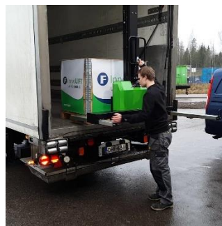
Wsuń widły i wjedź do środka