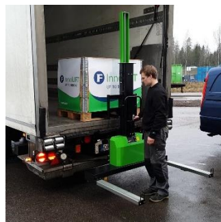
Podnieś korpus i wysuń widły transportowe