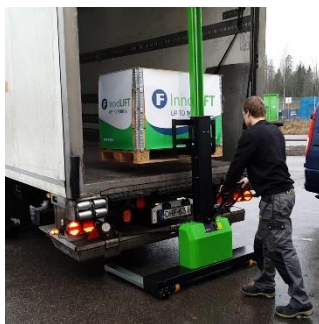
Umieść ładunek wewnątrz pojazdu