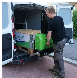
Wsuń widły i wjedź do środka