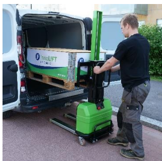
Umieść ładunek wewnątrz pojazdu