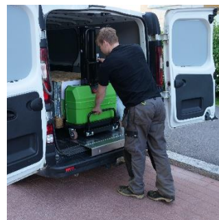
Ustaw towar i wózek w samochodzie

Samozaładowczy wózek podnośnikowy InnoLIFT jest przeznaczony do prac transportowych oraz załadunku i rozładunku towarów na samochodach dostawczych typu VAN, plandeka, kontener, samochodach ciężarowych i innych miejscach, gdzie użytkownik znajdzie zastosowanie dla tego typu urządzenia.