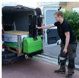
Wysuń widły transportowe i podnieś korpus